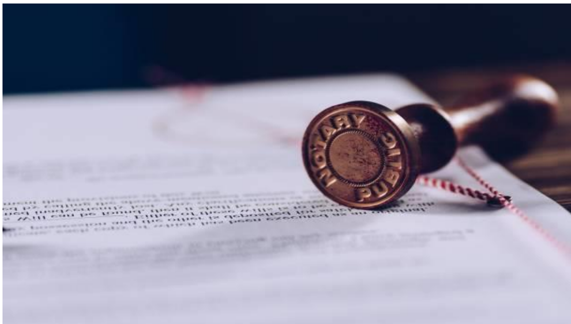
Notary public ink stamp on signed document. Law concept

Per Redacció 19/09/2023 3 Mins de lectura