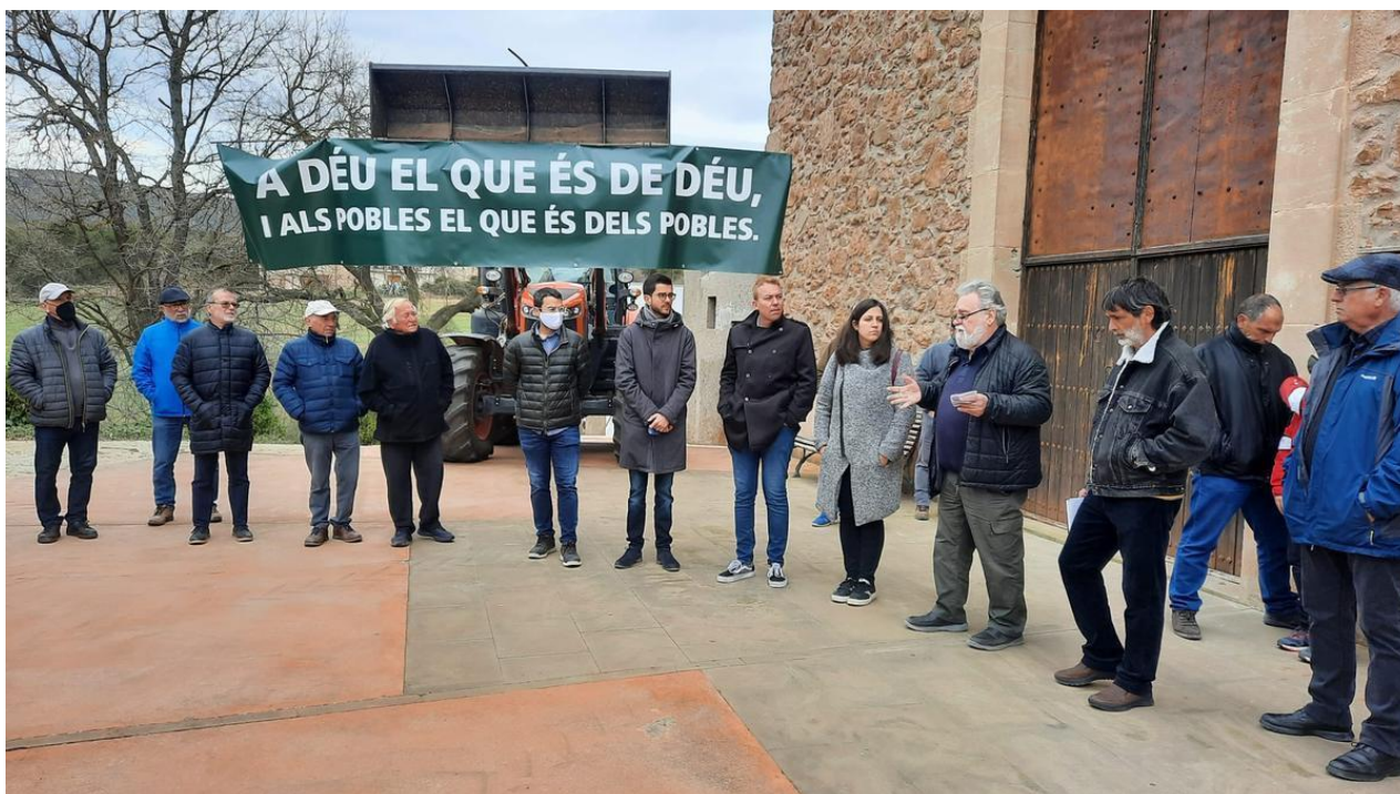
Concentració davant l'església de Sant Andreu de Maians, afectada per les immatriculacions, l'any passat

Unió de Pagesos, l'Associació de Micropobles de Catalunya i el Consell Comarcal del Solsonès demanaran aquest dijous a la Comissió de Justícia del Parlament que insti al Govern de la Generalitat a reclamar els registres de la propietat de totes les immatriculacions de l'Església Catòlica . Segons el sindicat agrari, l'obtenció de les notes simples (que és on es detallen tots els béns que conté cada finca) permetria saber l'abast real d'aquesta problemàtica i el llistat de 3.722 béns immatriculats que va fer la Generalitat es podria enfilars fins als 14.000 . També demanaran que el Parlament insti al Govern català a reclamar a l'Estat la nul·litat de totes les immatriculacions realitzades per la jerarquia catòlica des de l'entrada en vigor de la Constitució Espanyola.